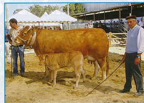
La championne femelle de ce Concours National portugais.

Le travail de l'association portugaise (techniciens et staff) est à saluer car le travail fourni pour développer la Limousine est remarquable.